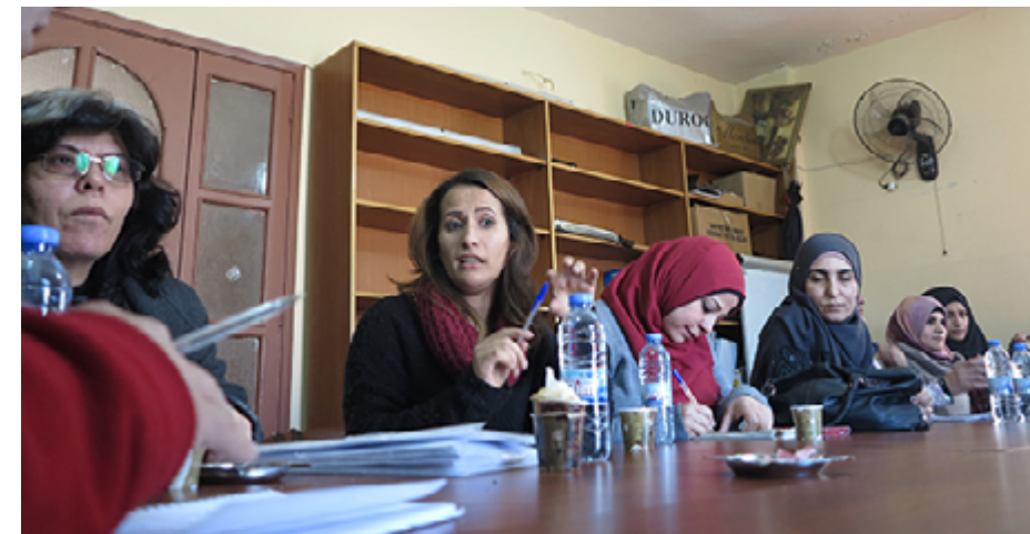
Réunion de jeunes femmes de Najdeh au camp de Nahr el-Bared.

Des associations comme Najdeh et Beit Atfal el-Sumoud ne mettent plus en avant leur affiliation politique initiale, FDLP pour la première et Fatah pour la seconde 4 . « Dans le but d'aborder les questions identifiées comme sociales, les acteurs se sentent obligés de les étiqueter comme apolitiques, ou non-partisanes : la pression vient des bailleurs de fonds et du public » 5 . Pour autant, la part grandissante des ONG dans la gestion quotidienne des services dans les camps et la professionnalisation de leurs équipes, que nous avons pu effectivement constater, correspondrait à une forme différente d'engagement, dans laquelle les jeunes