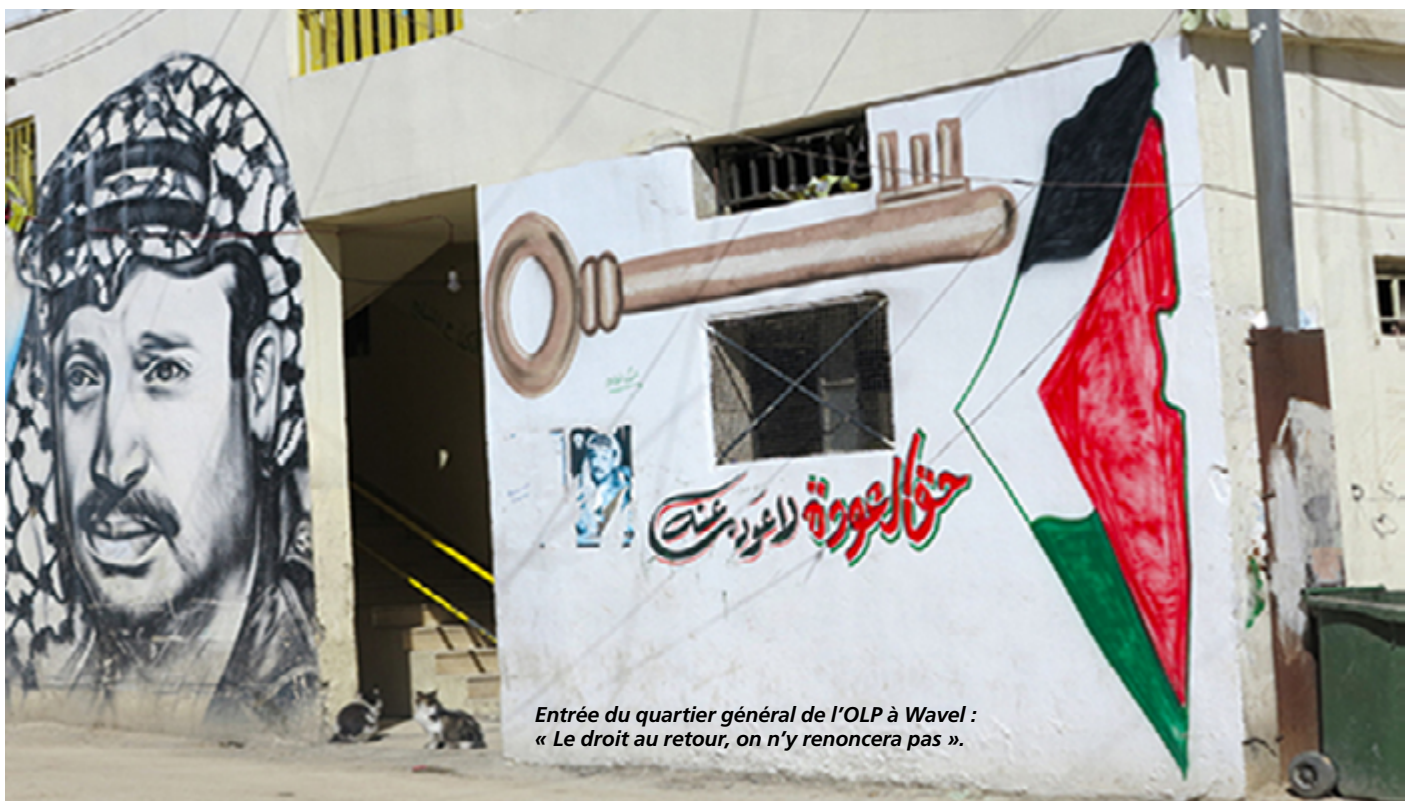
Entrée du quartier général de l'OLP à Wavel : « Le droit au retour, on n'y renoncera pas ».