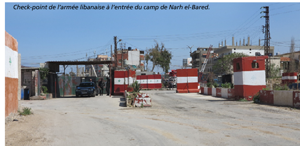
Check-point de l'armée libanaise à l'entrée du camp de Nahr el-Bared.