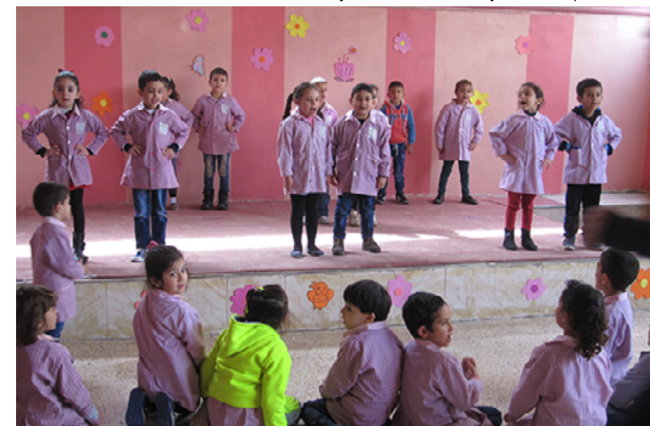
Le jardin d'enfants de Najdeh au camp de El-Buss.

Le désengagement de l'UNRWA, estiment nos partenaires unanimes, n'est ni un hasard ni une fatalité. L'agence n'existe que tant que le dos-