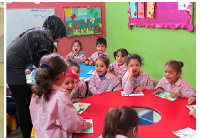
Le jardin d'enfants de Najdeh au camp de Beddawi.

ONG force l'admiration, tout comme leur faculté à poursuivre leur travail malgré les obstacles considérables.