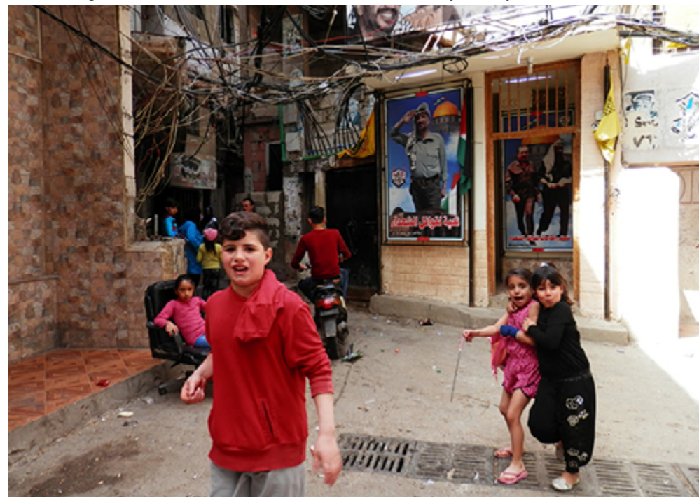
Jeunes réfugiés dans une ruelle devant le QG du Fatah-OLP à Burj el-Barajneh.

Nos partenaires palestiniennes, Najdeh, Beit Atfal as-Sumoud et Ajial, tout comme les associations libanaises Al-Ghad et Amel 1 que nous avons également rencontrées, font l'impossible avec des moyens limités. Qu'il s'agisse d'éducation ou de santé, notamment de santé psychique, dans les centres qu'ils ont établis dans tous les camps, ils tentent de produire les services indispensables à une population qui vit dans l'insalubrité, dans des conditions sanitaires et médicales à la limite de la survie. Ils se focalisent essentiellement sur les femmes et les enfants, particulièrement vulnérables. L'engagement du personnel et des volontaires de ces