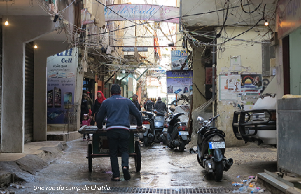
Une rue du camp de Chatila.