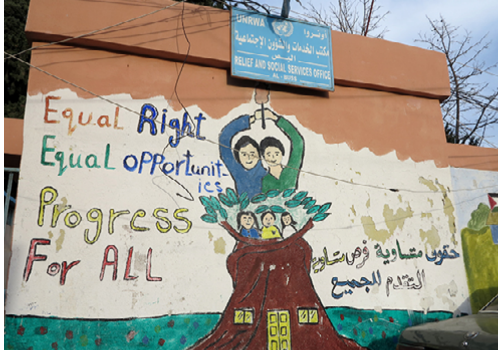
Le mur d'une école de l'UNRWA du camp de Ain el-Hilweh.

Le commerce reste le domaine privilégié dans les camps, l'activité artisanale ayant fortement baissé depuis l'interdiction par les autorités libanaises de faire entrer des matières premières, telles du bois, du fer, etc. En conséquence, ces professions sont exercées sans autorisation en dehors des camps et les ateliers peuvent à tout moment être fermés. Avec le temps les compétences se perdent et sont pas transmises aux plus jeunes. Cette poli-