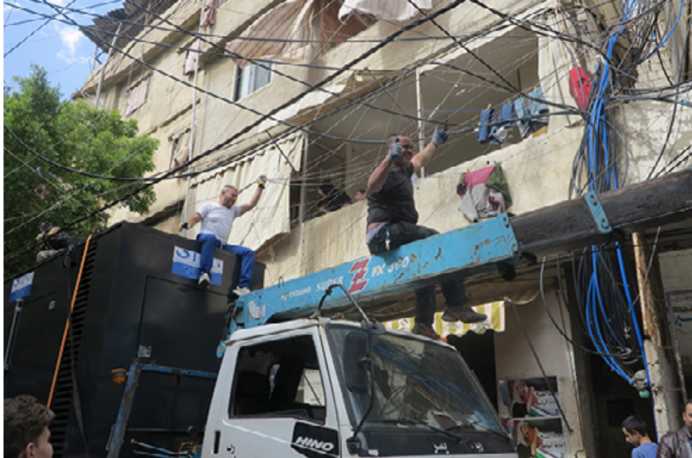
Passage difficile d'un camion sous les fils électriques au camp de Burj-el Barajneh. Les tuyaux bleus alimentent les appartements en eau...