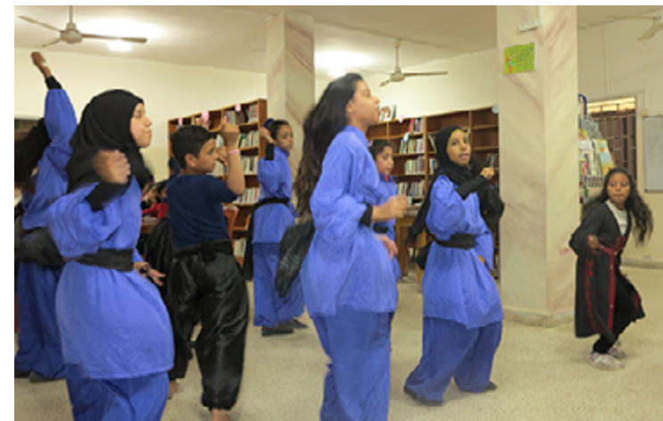
Répétition de Dabkeh au centre de Najdeh à Ain el-Hilweh.