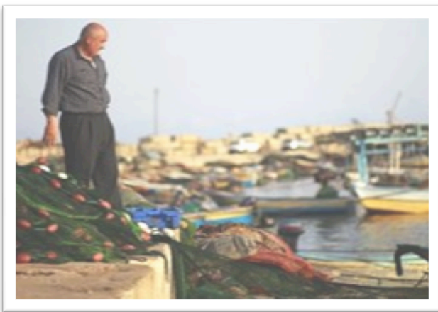
Un homme se tient aux côtés de filets de pêche vides au port de Gaza, 19 mai 2012.

L' Arche de Gaza est également solidaire de l'industrie de la pêche palestinienne à Gaza, qui, menacée par le même blocus israélien que notre campagne dénonce, ne peut exploiter ses eaux territoriales afin de subvenir à ses besoins.